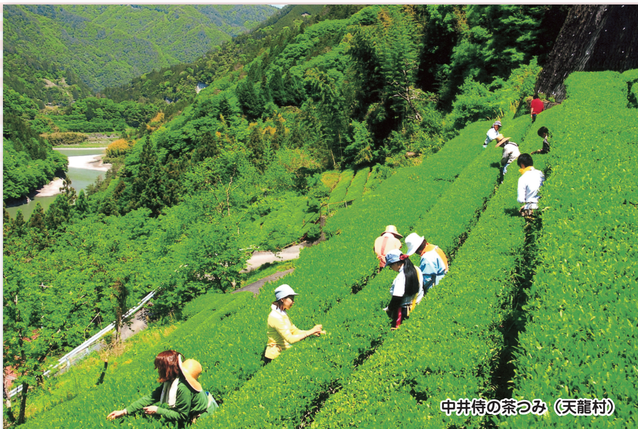
中井侍の茶つみ（天龍村）